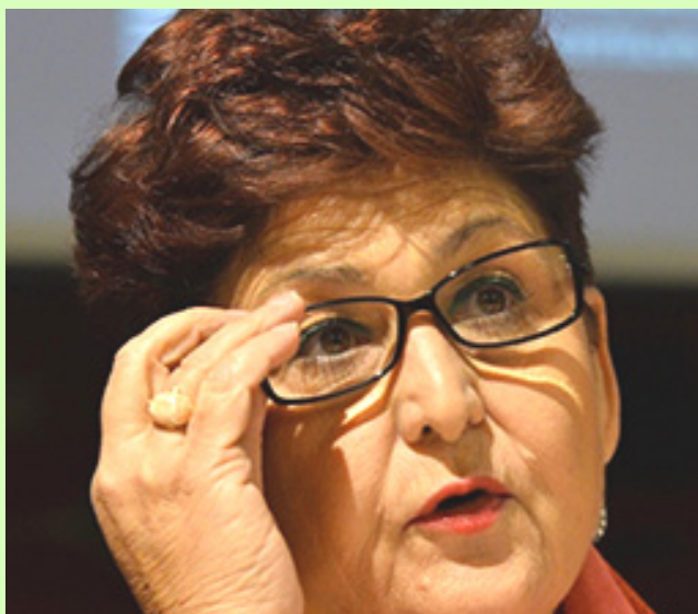
Teresa Bellanova, Ministra per le Politiche Agricole, Alimentari e Forestali

Bellanova ricordando come dietro ai prodotti ci sia il lavoro, l'impegno ed il sacrificio di moltissime imprese e lavoratori. "Garantirle e sostenerle anche con l'acquisto dei loro prodotti, significa garantire e sostenere una parte fondamentale della nostra economia e del nostro Paese. Abbiamo bisogno di rispettare le regole, certo, e quanto mai sono necessari la saggezza, l'equilibrio, la misura. Così, insieme, riusciremo a sconfiggere il Coronavirus. Distanti, ma uniti come non mai. Voglio essere chiara: sì al rispetto ferreo delle regole, perché dobbiamo assolutamente contenere l'epidemia, ma no a fermare l'Italia: non possiamo e non dobbiamo farlo. L'Italia deve restare in piedi", ha concluso Bellanova.