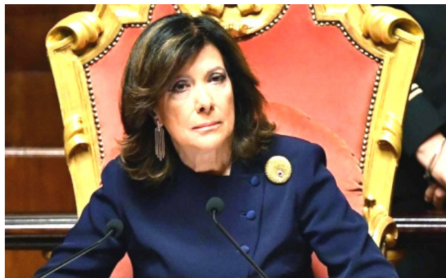
Maria Elisabetta Alberti Casellati. Presidente del Senato della Repubblica

to per il popolo italiano". La Presidente Casellati ha poi continuato aggiungendo che "le grandi trasformazioni sociali che hanno contraddistinto gli ultimi decenni non hanno