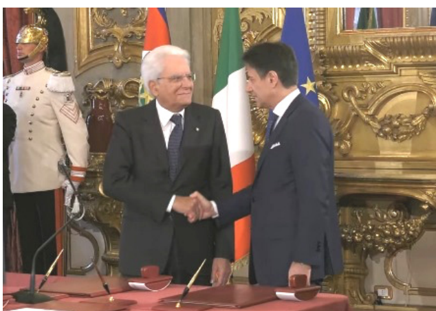
Il Presidente della Repubblica, Sergio Mattarella ed il Presidente del Consiglio, Giuseppe Conte.

La figura tecnica è quella di Luciana Lamorgese , ex prefetto di Milano ed ex capo di gabinetto sotto il ministro Angelino Alfano, che alla guida del Viminale sostituisce Matteo Salvini. Della pattuglia M5S fanno invece parte il capo politico Luigi Di Maio che (dopo la rinuncia al ruolo di vicepremier) ottiene la guida del ministero degli Esteri; le sue precedenti deleghe restano ai pentastellati, con Nunzia Catalfo neo ministro del Lavoro e delle Politiche sociali e Stefano Patuanelli neo ministro dello Sviluppo economico. Confermati Alfonso Bonafede alla Giustizia e Sergio