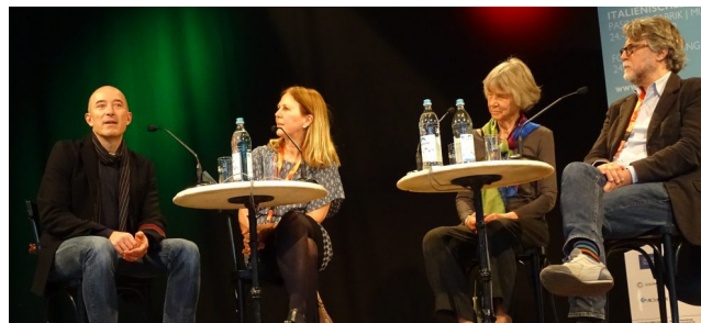
Il podio dei traduttori