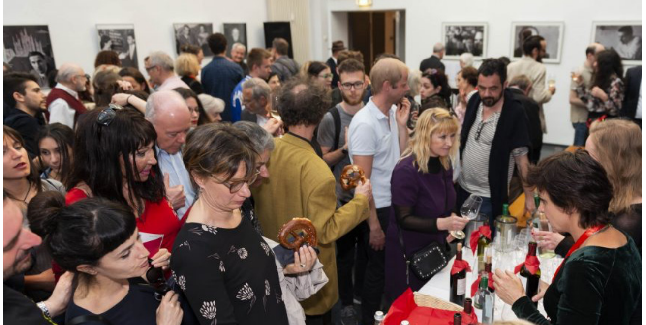
Il pubblico durante il rinfresco

nella piazzetta pubblico e autori si sono trattenuti a firmare le copie e a chiacchierare piacevolmente di letteratura prima e dopo gli incontri, godendo di una birra e della gastronomia del ristorante caffè Cantina. Un grazie a tutti coloro che hanno partecipato, agli sponsor che hanno collaborato e ai volontari senza cui non sarebbe stato possibile realizzare ILfest .