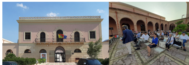
A sinistra: La facciata del Palazzo D'Aumale, a destra: i convegnisti nel cortile del Palazzo.