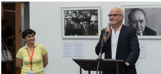
L'inaugurazione della Vernissage