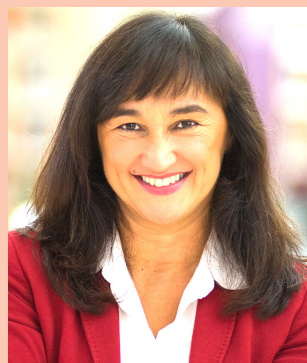
Sen. Laura Garavini