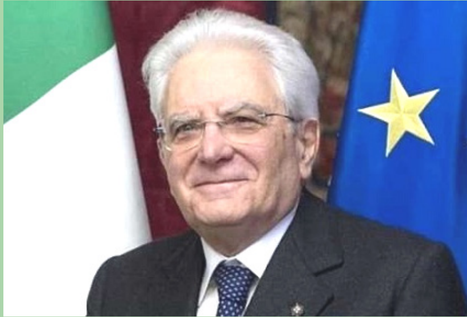
Sergio Mattarella Presidente della Repubblica Italiana