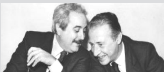
Da destra: i giudici Paolo Borsellino e Giovanni Falcone

e Paolo Borsellino ed il loro sacrificio, anticipato nelle parole e confidenze insieme ad una lunga schiera di Difensori dello Stato, affidati alla memoria delle prossime generazioni. Tali efferati delitti rappresentano uno spartiacque non solo nella storia siciliana macchiata di atroci omicidi di stampo mafioso, ma anche italiana, che proprio in quegli anni ha vissuto vicende dolorose, trame delle organizzazioni criminali, contro le quali, ieri come oggi è necessario opporre la propria coscienza di civiltà ed ogni mezzo predisposto dalla giustizia operante. L'asfalto di Capaci e di Via