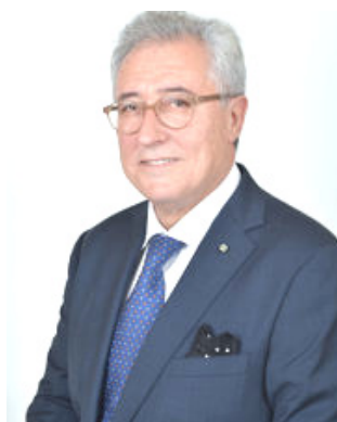
Sen. Francesco Giacobbe

ricongiungersi. Lo rileva il Senatore del Pd Francesco Giacobbe, che in proposito ha scritto una lettera al Presidente del Consiglio dei Ministri Conte ed agli altri Ministri competenti, nella quale si vuole portare all'attenzione del Governo sul caso di migliaia di coppie in queste situazioni. Nella missiva si chiede di aggiungere questa categoria alle esenzioni fin qui già predisposte per permettere ad una cittadina o ad un cittadino italiano di ricongiungersi al nucleo familiare. Alcuni