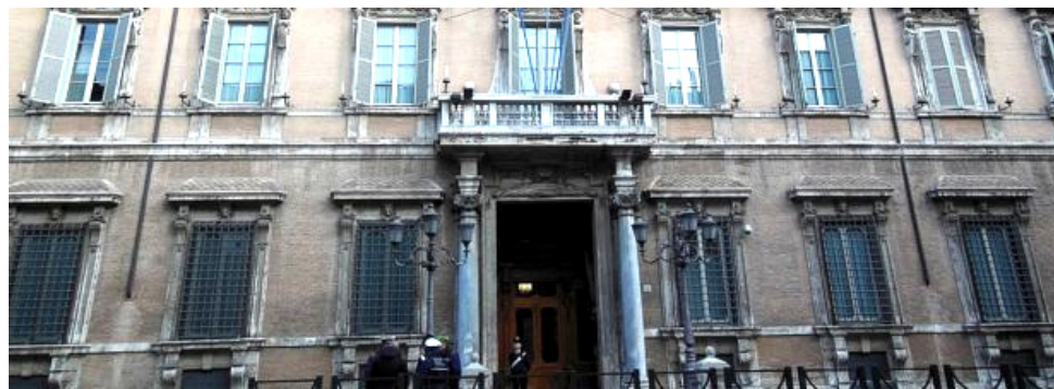
Roma: Palazzo Madama, sede del Senato

uno dei principali destinatari" ha evidenziato Conte - e l'iniziativa React EU , con una dotazione complessiva di 47,5 miliardi di euro, "grazie alla quale potranno essere proseguiti gli investimenti anti Covid a favore del sistema sanitario e a sostegno del reddito dei lavoratori e della liquidità delle imprese", ha aggiunto il